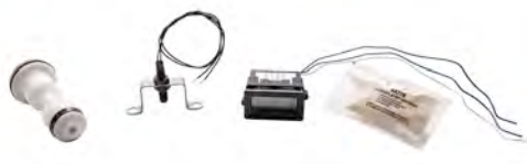
Componenti per il montaggio su pannello remoto