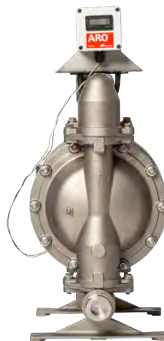
Kit montati su pompa